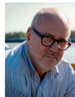
João Gilberto Noll (RS)